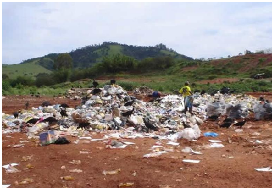
Situação dos catadores antes do início dos trabalhos desenvolvidos pela INTECOOP/UNIFEI