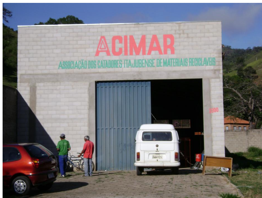
GALPÃO SUBSIDIADO PELA PREFEITURA