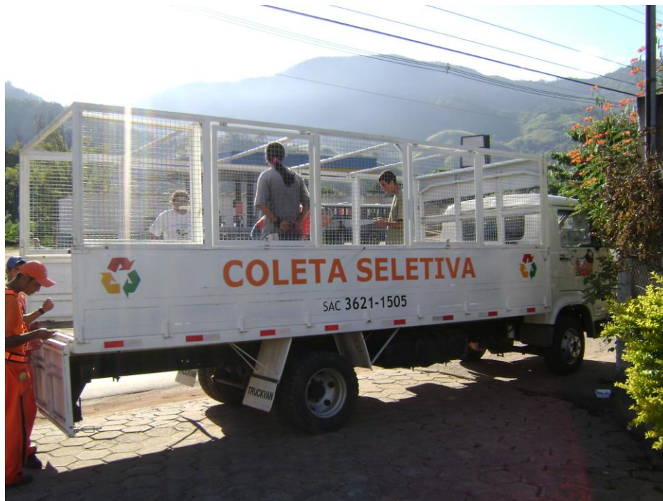
CAMINHÃO PARA COLETA SELETIVA